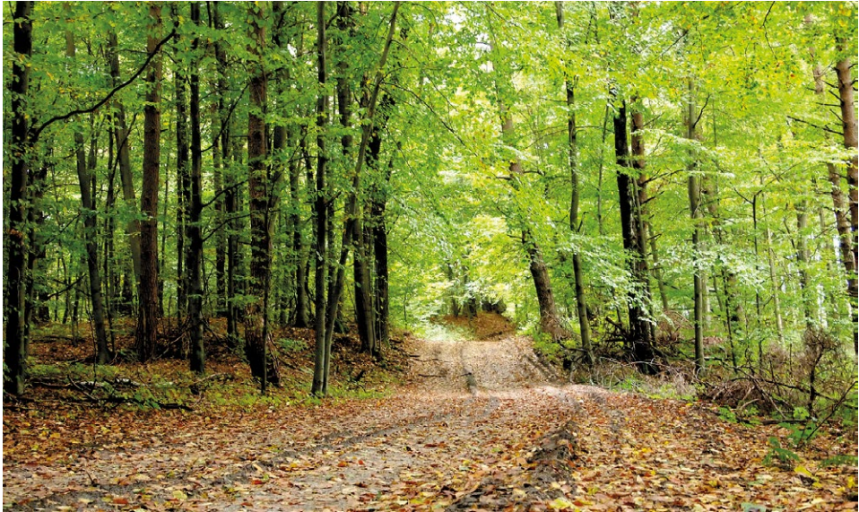
Fragment „zielonego” szlaku im. św. Brata Alberta 4 – podejście od strony Huty Lubyckiej.

Charakterystyczne dla otoczenia Monastynu bujne, leśne ostępy towarzyszyły temu miejscu od dawna. Na mapie z roku 1937 wyraźnie widać odsłonięte połacie łąk i pól, w sąsiedztwie licznych ludzkich osiedli. Dzisiaj,