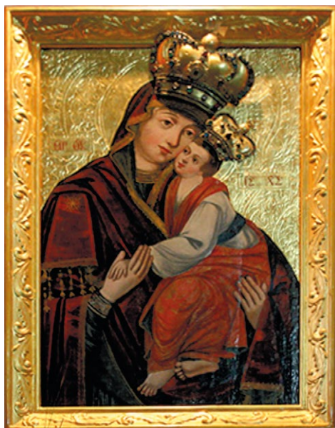
Ikona Matki Bożej Werchrackiej.

Według lokalnej tradycji początki prawosławnego życia monastycznego na wzgórzu koło Werchraty sięgają XII lub XIII wieku. Niektóre źródła podają, że werchracki monaster mógł powstać tu już w XIV wieku. Miał w nim mieć swoje miejsce skupienia, pochodzący ponoć z tych terenów św. Piotr Racki (Ratskij, Retenskyj), mnich i pustelnik, późniejszy metropolita kijowski (zm. 1326 r. w Moskwie), w roku 1339 zaliczony w poczet świętych prawosławnych 10 . Nie znajduje to jednak potwierdzenia w dokumentach, a samo życie