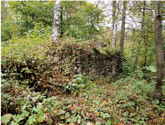
Fragment muru otaczającego klasztor.

Istotnym elementem życia monastycznego był przewidziany dla formacji benedyktyńskiej ubiór. Czarny, zbliżony do sutanny jezuitów habit,