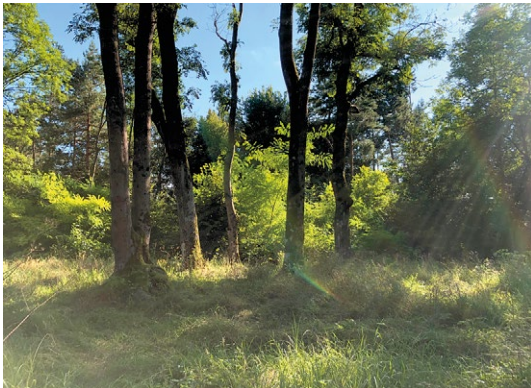
Plac klasztorny, fragment południowo-zachodni – widok obecny.

Charakterystyczne dla otoczenia Monastynu bujne, leśne ostępy towarzyszyły temu miejscu od dawna. Na mapie z roku 1937 wyraźnie widać odsłonięte połacie łąk i pól, w sąsiedztwie licznych ludzkich osiedli. Dzisiaj,