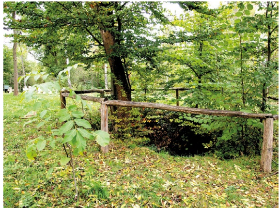
Częściowo zasypana dawna studnia.