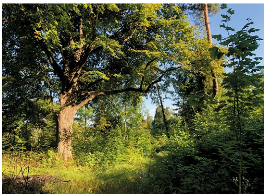
Kilkusetletnia lipa u podnóża monasterskiego wzgórza (po prawej).