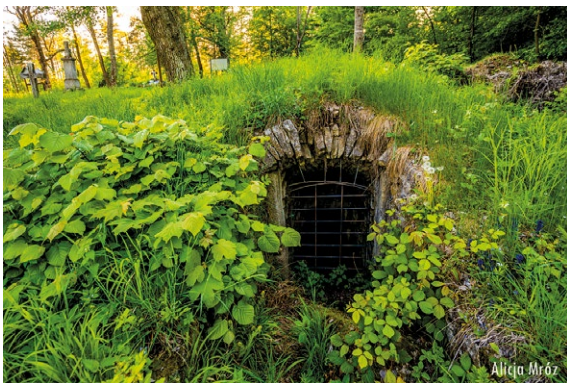
Wejście do jednej z piwnic.

z podwyższonym kołnierzem i wąskimi rękawami zakończonymi mankietami, uszyty z prostego, ogólnie dostępnego sukna, nakładany był na koszulę i spodnie. Przepasywano go też czarnym pasem. Wychodząc poza teren klasztoru, na habit narzucano palendrę , czyli rodzaj szerokiego płaszcza z kapturem. Obuwie stanowiły trzewiki. Latem głowę chronił kapelusz, zimą zaś podszyta lisim futrem czapka. Reguła zakonna zabraniała posiadania i używania zegarków, tabakerek, łańcuszków czy innych przedmiotów wartościowych. O zaopatrzenie zakonników w ubiory troszczył się zakon, wypłacając mnichom określoną sumę pieniędzy na pokrycie kosztów materiału i krawca (tzw. habitowe).