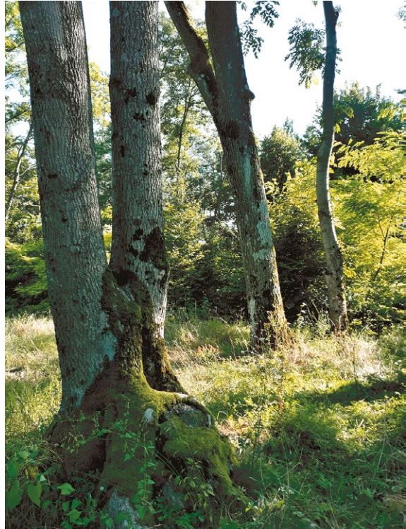
Drzewo z dziuplą...

Pozostałością po wydarzeniach z okresu drugiej wojny światowej na terenie dawnego klasztoru jest pomnik upamiętniający członków Ukraińskiej Powstańczej Armii z sotni „Bisa”, którzy zginęli w walce z wojskami NKWD, stoczonej wiosną 1945 r. we wsiach Mrzyglody i Gruszka.