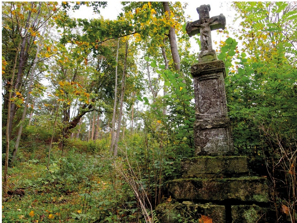
Krzyż bruśnieński przy drodze na Monastyr, wejście od strony Werchraty.

napoje alkoholowe były standardem w codziennym menu. Być może nie pozwoliła na to skromna liczebność zgromadzenia, zajętego bieżącą, monastyczną posługą, a może chodziło o zwykłą niegospodarność albo fakt, że niewielki areal ziemi nie dostarczał wystarczającej ilości zboża niezbędnego do ważenia trunków? Na to ostatnie zdają się wskazywać zapisy w przedkaszajnych rejestrach. Prawdopodobnie z tej przyczyny mnisi nigdy też nie pokusili się o wybudowanie młyna.