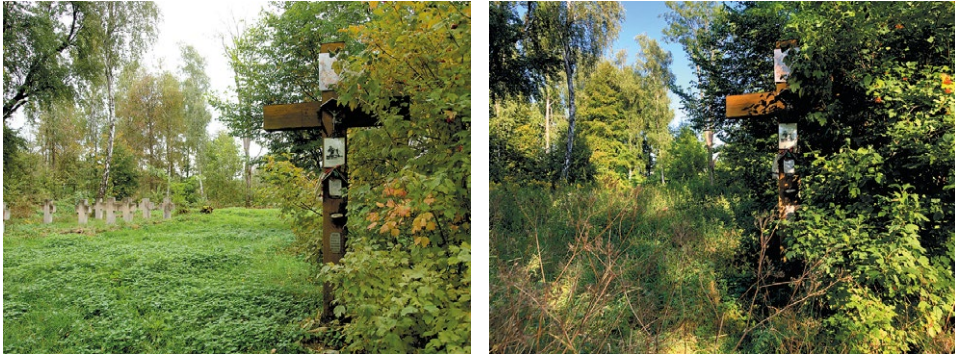
Drewniany krzyż, upamiętniający miejsce, w którym na monastyrskim wzgórzu stała cerkiew pw. Opieki Najświętszej Marii Panny. Na zdjęciu po lewej, na drugim planie, widoczne krzyże z okresu pierwszej wojny światowej.