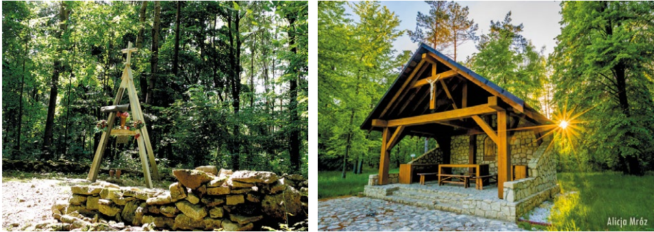
Miejsce upamiętniające pustelnię brata Alberta Chmielowskiego. Po lewej: stan z 2019 r., po prawej: widok współczesny, 2020 r.

szaragi (wieszaki) na odzież. Na ścianach wieszano obrazki o treści religijnej. W ziemie cele ogrzewano prostymi piecami. Na terenie klasztoru znajdowało się również kilka podpiwniczonych izb (w tym klasztorna kuchnia) i budynki gospodarcze. W ich skład wchodził niewielki spichlerz i wozownia, a na ich tyłach pomieszczono stajenkę i drewnianą komórkę na siano. Do gospodarstwa klasztornego należała również pasieka i mały, drewniany browar.