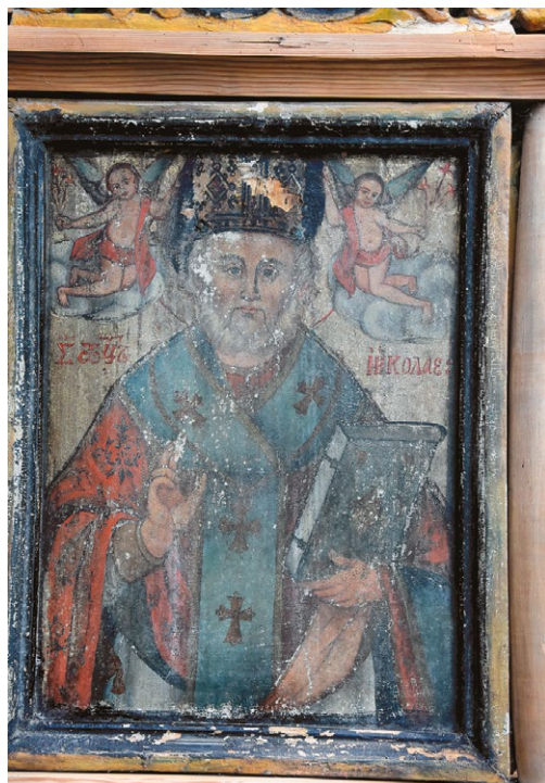
Ikony: Wniebowzięcie Najświętszej Maryi Panny (po lewej) i św. Mikołaja (po prawej) z Kapliczki na Wodzie w Siedliskach, 2019 r.

Nie zawsze jednak tak było. Kapliczka stała w tym miejscu już w końcu XVIII w. 5 Według przekazywanej z pokolenia na pokolenie tradycji pasterzowi pasącemu owce na pobliskim pagórku ukazała się postać Matki Bożej. Przestraszony chłopak odruchowo uderzył postać trzymanym w ręku batem, a ta rozplynęła się w nurcie rzeki. Aby przebłagać Matkę Bożą za czyn chłopaka, mieszkańcy wsi w miejscu objawienia ustawili kapliczkę. W jej wnętrzu znalazł się obraz Matki Bożej, sporządzony według opisu pasterza. Jak się później okazało, wizerunek ten był tożsamy ze słynną ikoną Matki Bożej z pobliskiego Sokala (jej postać ma zresztą stojąca przy kapliczce współczesna rzeźba, ufundowana przez mieszkańców i posadowiona w 2003 r. 6 ). Z czasem do kapliczki w Siedliskach zaczęli przybywać pielgrzymi, aby zaczerpnąć wody, mającej od pamiętnego zdarzenia właściwości uzdrawiające. O uzdrowieniach świadczyć miały znajdujące się na ścianach kapliczki liczne wota.