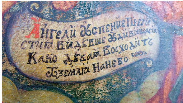
Inskrypcja na ikonie Wniebowzięcia Najświętszej Maryi Panny z Kapliczki na Wodzie w Siedliskach.

Ukazane powyżej cywilizacyjno-kulturowe uwarunkowania silnie kształtujące sztukę sakralną tych obszarów XVIII-wiecznej Rzeczypospolitej pozwałyby bez wątpliwości zakwalifikować obraz z Kapliczki na Wodzie do grupy ikon, czy – jak wolałaby interpretacja ortodoksyjna – obrazów „zachodnich”. Powielilibyśmy jednak tym samym tropy współczesnych badaczy, a tego robić nie należy. Dziś, bardziej niż w nieodległej jeszcze przeszłości, jesteśmy świadomi, że procesy kulturowe i cywilizacyjne mogły przebiegać w pewien sposób autonomicznie, rządząc się własną dynamiką i kierunkiem rozwoju. Więcej uwagi powinniśmy poświęcić zatem studiom nad lokalnymi tradycjami i historią postrzeganą jako opowieść o konkretnych ludziach, artystach i ich sztuce powstającej w konkretnym miejscu i czasie, osadzonej w konkretnej tkance społecznej i kulturowej.