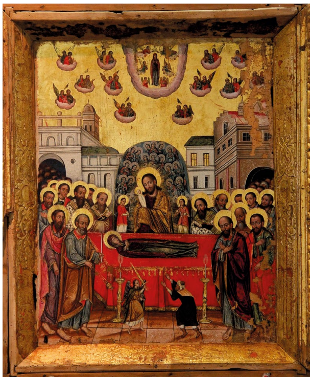
Zaśnięcie NMP, Ikona z XVII w. z terenów Ukrainy, Muzeum Narodowe we Lwowie.

Pod wpływem latynizacji sztuki prawosławia, które pojawia się po unii brzeskiej (1596 r.), a swój szczyt przybiera w początkach XVIII w. 14 , w ikonografii ZAŚNIĘCIA Chrystus często ma uniesioną w geście błogosławieństwa prawą dłoń, a dusza Maryi nie jest ukazywana już jako owinięte pieluszkami niemowlę, lecz Niewiasta w sukience. Wtedy też, w górnej części kompozycji, zaczęto przedstawiać wyobrażenie Bogurodzicy na obłokach 15 , zgodnie z łacińską sztuką sakralną. Właśnie ten element przedstawia ikona Matki Bożej z Siedlisk.