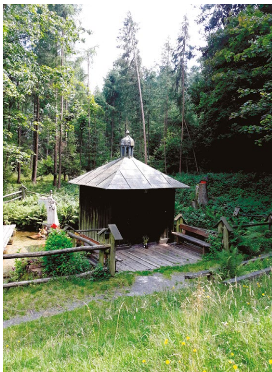
Kapliczka na Wodzie w Siedliskach, 2020 r.

Wśród licznych obiektów sakralnych wschodniej Lubelszczyzny 3 znajduje się jedenaście źródeł uznanych za święte. W przypadku siedmiu z nich sprawowany kult jest związany przede wszystkim z Matką Bożą (Siedliska, Jeziernia, Turkowice, Kotorów, Hrubieszów, Uchanie, Leśna Podlaska). Pozostałe są poświęcone: św. Annie (Wasyłów), św. Wojciechowi (Tomaszów Lubelski), św. Mikołajowi (Kryłów) i św. Janowi Nepomucenowi (Gołaicha k. Czartowca) 4 .