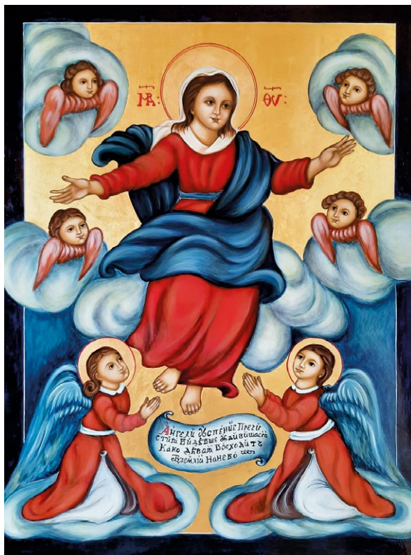
Małgorzata Cichoń – kopia ikony Wniebowzięcia NMP.

wyjątkowy, unikatowy. Matka Boża pod postacią prostej dziewczyny wspartej na obłokach wznosi się do nieba adorowana przez anioły w uroczych żupanikach – staropolskich strojach z epoki. Bogurodzica ma spracowane dłonie, bosa i nieco zniekształcone haluksami stopy. Co ciekawe, w kanonicznej ikonografii jedynie nieliczne wyobrażenia Matki Bożej pokazują nieśmiało kosmyki jej włosów. Z reguły schowane są one starannie pod czepcem. Tu Maryja ma na głowę, ledwie narzucony, skromny welonik, a lekko niesforne włosy rozrzucone są na ramionach. Majestatu dodają jej za to szaty w barwach królewskiej purpury i niebiańskich błękitów. Barwy te to klasyka przedstawień ikonograficznych Chrystusa i Maryi. Wspólnie tworzą one niezwykłą harmonię pomiędzy tym to ziemskie a tym co niebiańskie. Pomimo tej harmonii obydwie kolory na ikonach są zawsze starannie oddzielone, nie zlewają się, nie mieszają. Ma to znaczenie symboliczne – rozdzielenia dwóch rzeczywistości: ziemskiej i niebiańskiej. Patrząc na wizerunek Bogurodzicy z Siedlisk, możemy dostrzec w jej postaci współczesną dla czasu powstania ikony kobietę. I to jest w niej cudowne.