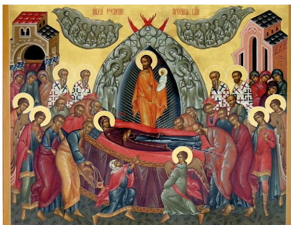
Zaśnięcie NMP – ikona bizantyjska, XV w. Źródło: https://www.cerkiew-minskmaz.pl/o-ikonie-zasniecia-bogurodzicy [dostęp: 10 XII 2021]

Główną postacią na najwcześniejszych ikonach Zaśnięcia NMP nie