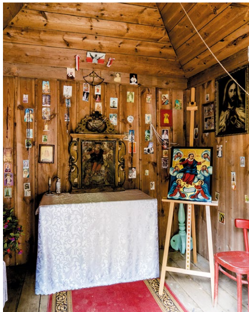
Wnętrze Kapliczki na Wodzie w Siedliskach z oryginałem i kopią ikony Wniebowzięcia NMP, 24 lipca 2021 r.